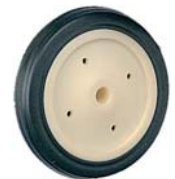
Recambio: Serie 1001 GN

Acabado: Platinas Laterales de acero estampado, cincadas en blanco brillante y cromado a partir de 100 m/m.